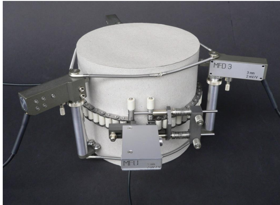
Bild 1: Längenänderungsmesssystem MFD 3 mit MFU 4 für Umfangsmessung Kleinste Messlänge des MFD 3 in Kombination mit MFU 4 = 60 mm